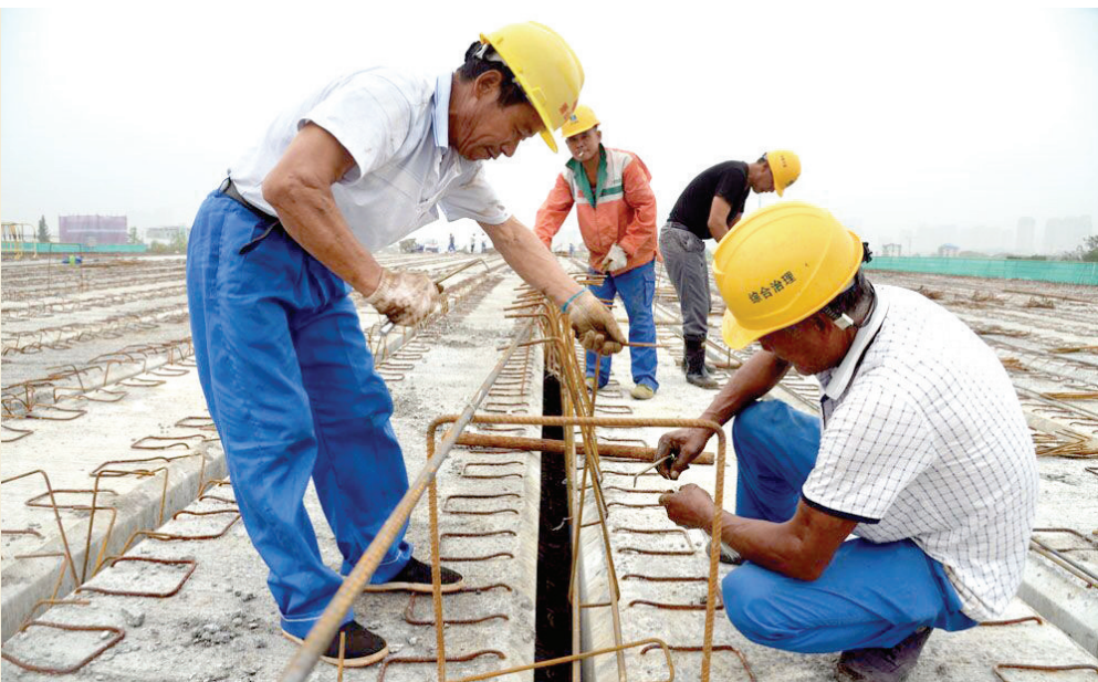
近日,铁路杭州南站站前东路长山直河桥已进入桥面施工阶段。到2019年底完工后,将完善南站的交通配套。