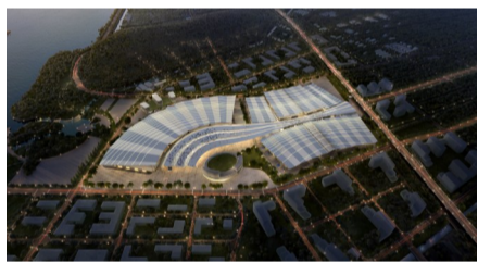
杭州大会展中心项目

完善1.45平方公里的杭州生物科技谷规划编制,以赛默飞—健新原力CDMO合资项目,药源新地CRO项目,冠科美博、迈邦生物等生产研发项目,康合家、怡亚通等生物医药流通项目等为引领,吸引更多优质项目落户。全年共引进生物医药项目8个,计划总投资达26.2亿元。两大生物医药创新服务配套项目,即总面积10万平方米的杭州生物科技谷创新服务