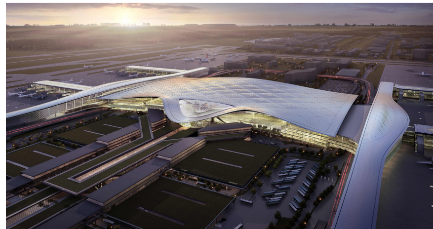
杭州萧山国际机场三期项目

全年实施传统企业提升改造项目9个,包括总投资3亿元的速博雷尔智能工厂项目,总投资5亿元的杰牌传动智能工厂项目等。积极深化“亩均论英雄”改革,全年整理低效企业114家,占地面积约852亩。