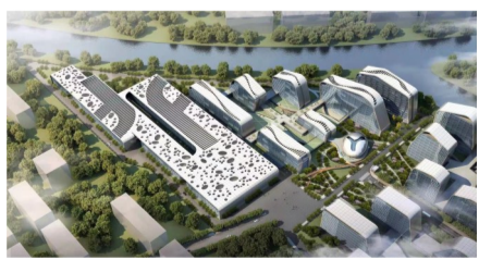
健新原力全产业链生物医药基地

按照自贸区萧山片区建设的“3533”方案,不断创新机制,务实奋进,加快推进自贸区空港板块建设,两大项目被列为全省自贸区建设首批十大创新成果。探索综保功能在B保的先行先试,跨境进出口实现全模式运行,空港成为全国首个走通9710和9810“清单+报关单”四种模式的跨境园区。沃富特等优质项目顺利落地,全球购直播基地项目有序跟进;寄递渠道进口个人物品“数字清关”及空港园区复合型监管场所入选自贸区杭州片区第一批制度创新优秀案例;物产安橙—中国农业银行跨境收结汇系统在空港跨境园区