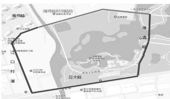
杭州市公安局萧山区分局 2022年5月30日

施工期间,如需对交通组织措施再作调整的,公安机关交通管理部门将另行通知。请广大机动车、非机动车驾驶员和行人自觉遵守本通告规定,并服从现场交警和管理人员的指挥。特此通告。