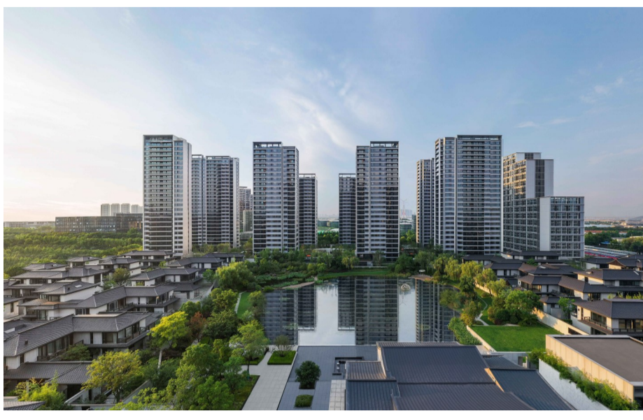
湖悦江南院交付实景图