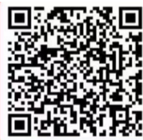
扫二维码开通中行数字钱包

活动地点: 杭州、温州、金华、义乌、绍兴、湖州各大肯德基门店(加盟店、景区交通枢纽等特殊餐厅除外)