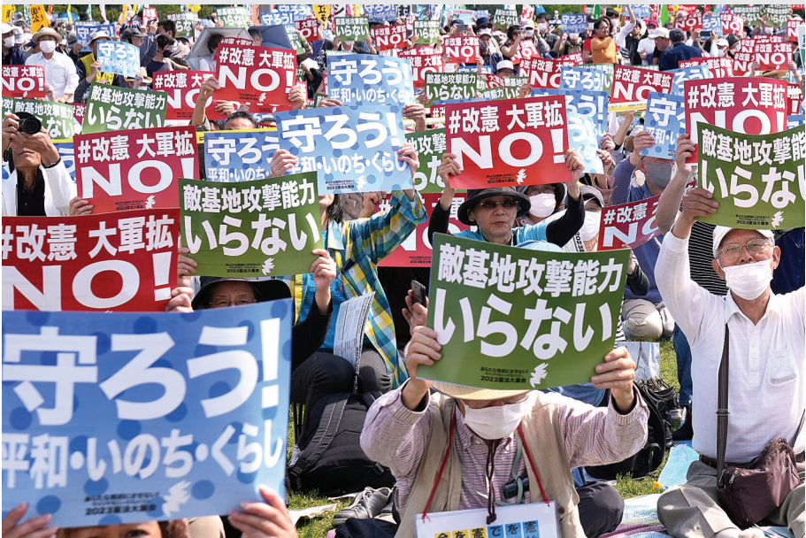
5月3日是日本宪法纪念日。当天,约2.5万名日本民众聚集在东京有明防灾公园的广场上,举行了守护宪法集会,他们打出守护宪法、反对强军扩武、不要反击能力、反对修改宪法等内容的标语和旗帜,呼吁守护宪法、守护和平。