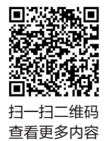
扫一扫二维码 查看更多内容

因为亚运会的延期,这对小夫妻原定于一十一黄金周举办的婚礼不得不取消,但两人如今有了别的计划。“首要任务当然是尽全力做好自己的工作,等亚运会圆满结束后,我们打算干脆将婚礼改为旅行结婚,一起出去看看祖国的大好河山。”