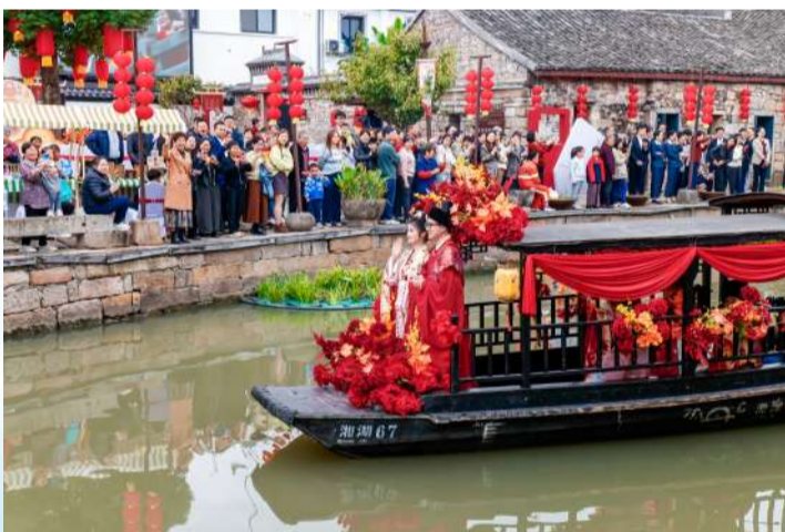
古韵官河见证集体婚礼

从道路整治到夜宴璀璨,从环境整治到协同治理,一系列精细化管理举措让工业镇的城市面貌脱胎换骨,“品质”成为衙前镇最直观的城市名片。