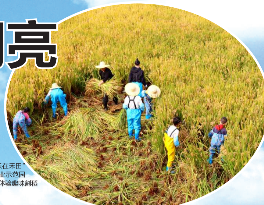
“乐在禾田”农业示范园内体验趣味耕种