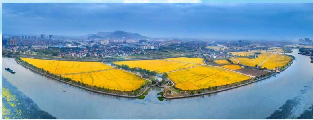
西小江沿线风景如画

如此来看,“青年兴镇”已成为当下衙前的战略路径,青年集聚规模与生活幸福感持续提升,产业与人才正实现双向奔赴。