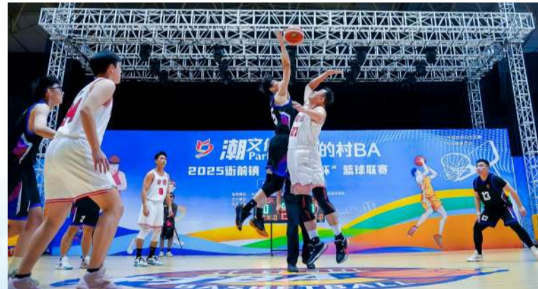
衙前镇文体中心多彩活动点亮群众生活

“现在镇上的活动丰富多彩,我每周六都固定带孩子去看街头旋律的演出。”一位村民的感慨,道出了衙前群众对公共文化服务的认可。在衙前,“月月有活动、周周有培训、处处有特色”已从承诺变为现实,比如,“露天剧场”将歌舞曲艺送到村民家门口,文化礼堂内莲花落与小品交相辉映,文体中心广场“文艺赋美”周五准时赴约,更有自主品牌“衙九大讲堂”驻点兴书房,以月均2-3场的频次持续输出,让孩子感受传统文化的精彩。