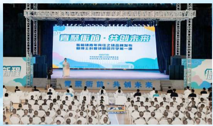
衙前镇发布“青年向往之镇”品牌