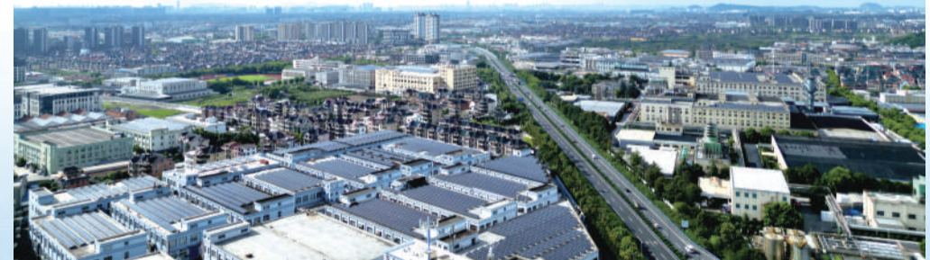
“十八里经济长廊”沿线企业生产加工忙

“空间就是生产力”,这个道理我们一直在践行。在衙前镇相关负责人看来,身为镇域面积最小的乡镇,就不能回避土地要素制约的问题。为此,衙前镇率先打响“空间革命”,编制完成全区首个《全域低效用地再开发规划》,其创新实践入选自然资源部典型案例,并成功承办市低效用地再开发现场会,让可复制推广的“衙前模式”走得更远。