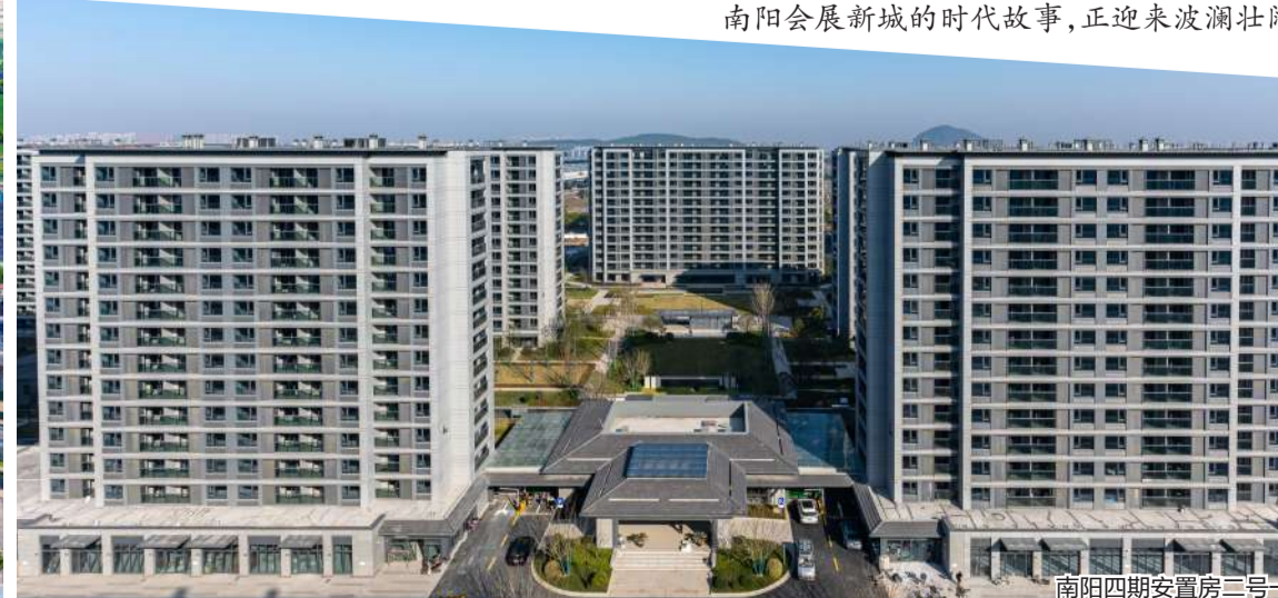
南阳四期安置房三二期

回首来时路,“雄关漫道真如铁”;试看脚下路,“而今迈步从头越”;展望未来路,“直挂云帆济沧海”,南阳会展新城的时代故事,正迎来波澜壮阔的新篇章。