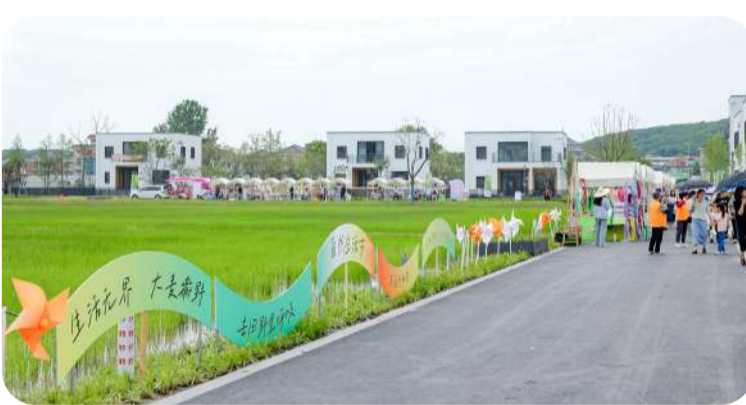
“大妻农夫·南阳”农文旅产业园

会展赋能,文旅融合。2024年开业的“大妻农夫·南阳”农文旅产业园,依托与杭州大会展中心毗邻的绝佳区位,园区精心布局多彩农田、亲子研学、拓展营地、主题垂钓、萌宠互动、休闲餐饮等多元业态,生动展现了“田园+会展+文旅”的融合发展成果。“不少游客慕名前来打卡,也让我们对园区发展更有信心。”产业园负责人说道。