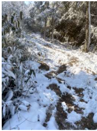
@李子成熟了 萧山“雪山” 趁着萧山下雪,来看雪啦!一个人也可以爬山。