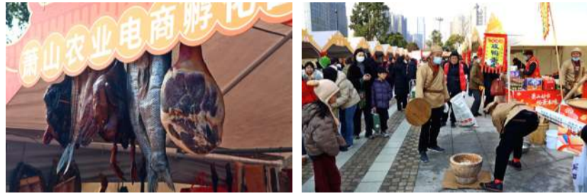
@大海 要过年了办年货 要过年了办年货,北方叫赶大集,萧山称年货好市!酱鸡酱鸭火腿肉,带鱼咸萝卜干,包子馒头棒棒糖,品种琳琅满目,萧山好市里热闹非凡!其实现在我们日常生活天天都像是过年,真到过年了却不知道买啥吃!不少人在“好市”里拍了几张照片就走了。