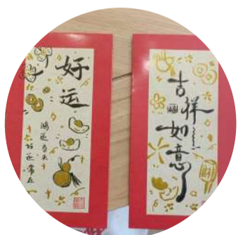
@伊娃菲 原来红包还可以这么玩 今天是回老家写写画画的一天,原来红包还可以这么玩!据说画的红包很受欢迎。