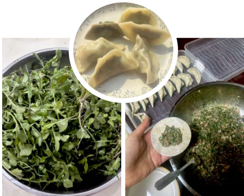
@醒狮妹妹 一起来挖野菜,吃饺子 荠菜,春天的使者,带着清新的香气,蕴藏着丰富的营养。虽然刚过立春,萧山周末温度也很低,但是作为开春的仪式感荠菜水饺可不能少。