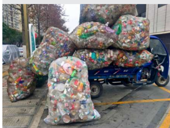
@黄氏人家 年终卖废品 临近春节,废品回收站生意也变火了,废弃纸板、塑料瓶、各种杂物……大家伙除旧迎新,新年图个吉利!