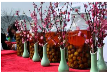
@傅灿良 梅花进入盛放期 进化吉山梅花已进入盛放期,引来市民拍梅打卡。

萧山发布客户端《萧友圈》是由萧山区融媒体中心倾情打造,旨在为所有爱分享、爱交流、爱学习的“萧友”们提供交流讨论、创作分享、情感表达的萧山本地生活线上互动平台,平台内设签到、积分、话题、报料、奖励机制等,让发帖用户真正成为内容的生产者、线索的提供者、资讯的参与者。