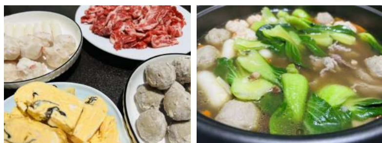
@慧儿 冬天与火锅最配 买上一大盆现切的雪花牛肉,搭配丸子和自家做的鸡蛋糕,再加上爱吃的蔬菜,锅底选用了菌菇汤,吃得鲜香热乎!