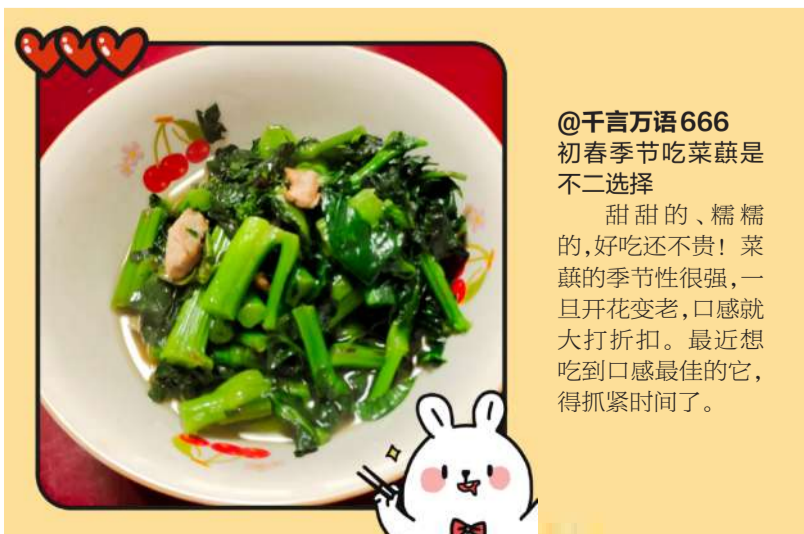
@千言万语666 初春季节吃菜蔬是不二选择 甜甜的、糯糯的,好吃还不贵!菜蔬的季节性很强,一旦开花变老,口感就大打折扣。最近想吃口感最佳的它,得抓紧时间了。