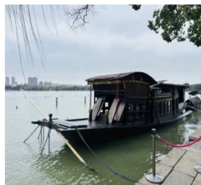
@慧儿 三代人的慢旅行

每年寒暑假,我们都会带上老人和孩子,三代人一起在省内自驾游,三四天的行程,图的就是这份轻松和自在。