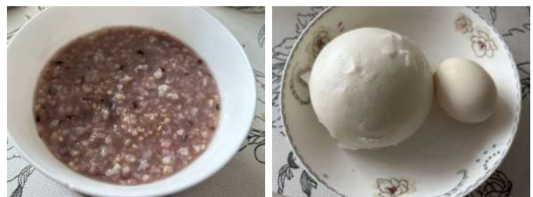
@读友_N3CF39 各有各的活法

儿子在上海安家,平常小夫妻工作很忙,不过他们也把自己的生活安排得妥妥的。这不,早上起来还吃到他做的“懒人”早餐,幸福感满满。杂粮粥是昨晚电饭煲预约煮好的,早上起来就用蒸锅下面煮鸡蛋,锅架上蒸点馒头包子之类的,等洗漱完毕都可以吃了。儿子从小就比较独立,我们老夫年轻时工作忙,也没人来帮我们打理家务,平常我们就教儿子一些生活技能,后来即使他走得很远,也不用担心他生活有什么问题,所谓“授人以鱼不如授人以渔”是很有道理的。