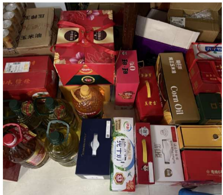
@大图因珍 过年礼包你们拿不拿?