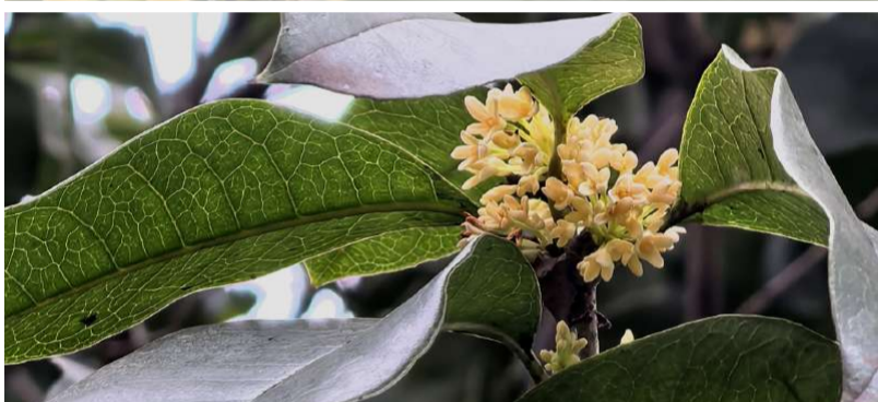
@清竹晨风 春日桂花惊艳

《如梦令·江城桂绽惊艳》 昨至西溪凝伫,忽遇桂华轻吐。 淡馥漫幽林,惊艳游客幻幕。 休负,休负,且把雅情留住。