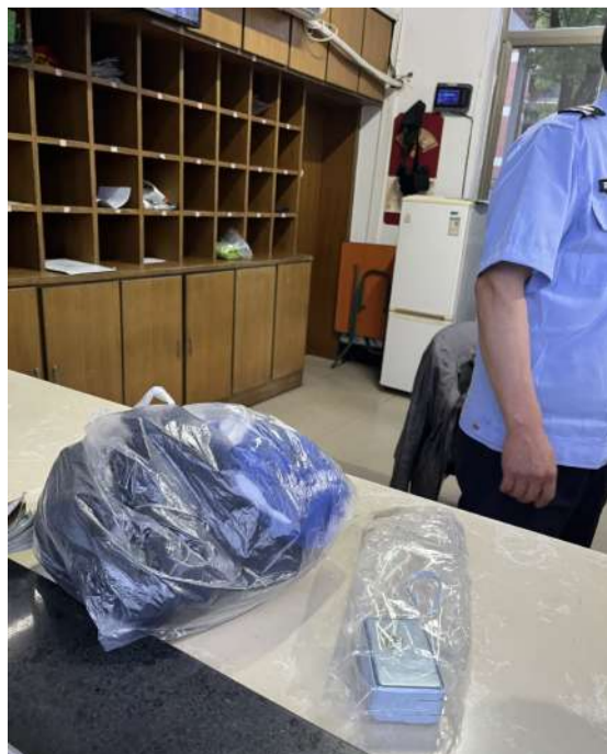
@清水 做好事就是心里很开心

我得学着释然,姐姐也算给我上了一课!人生很长,凡事皆有可能,努力的痕迹终将会在某一天爆发!