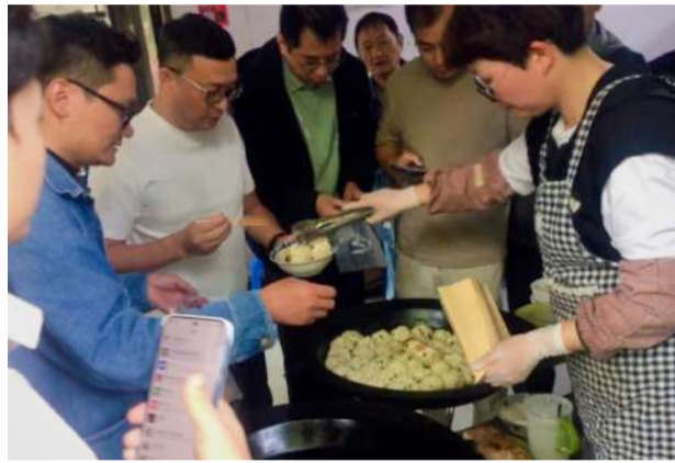
@黄氏人家 家门口的美味 楼塔煎包出锅啦!香气扑鼻,松软可口,看看这排队的架势,就知道有多少人喜欢这一口了。