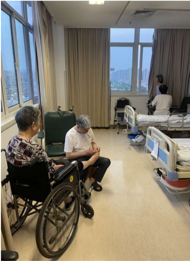
@杨柳菁菁 住院楼的人间温暖

说起萧山年糕,藏着老底子的味道。不同于周边区域普遍的大米年糕,它是用糯米与玉米制成的,块头扎实,切条后养在水缸里慢慢吃。正月里,年糕泡饭、炒年糕是家家户户的日常。以前下地干活的人,泡饭里加几块年糕,饱腹又耐饿,干起活来更有劲儿。今天用油煎到外酥里糯,撒上灵魂葱花和盐,咸香十足,一口下去,独属于家乡的味道,含金量懂的都懂。