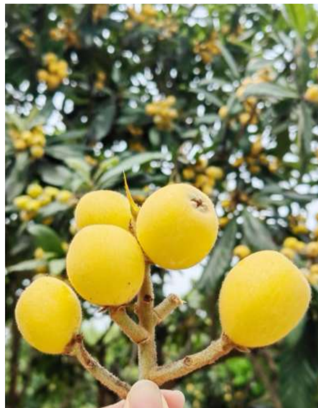
@小草莓 萧山南片人刻在骨子里的家常味

小满时节,万物将满未满,恰到好处。老话常说“小满枇杷半坡黄”,满树金黄的枇杷,是小满最生动的模样。吃上酸甜的枇杷让人愉悦,登高摘果更是满心欢喜,而把这份丰收的美好分享给萧友圈的各位朋友,更会收获双倍的温暖与幸福。