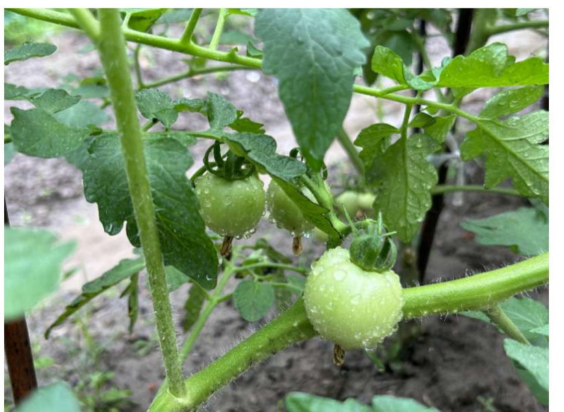
@读友_N3CF39 自己动手丰衣足食

感慨于买来的番茄实在不好吃,老是怀念小时候自然养熟的番茄味道,于是今年到老家借了一点土地,种上了心心念念的老品种番茄,看到挂在枝条上的小番茄,期待红红的番茄挂满枝头的景象。