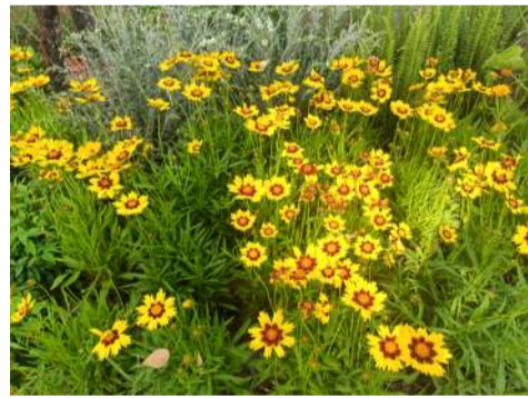
@读友_悠然随风 公园一角

工人路拐角处小公园里的花儿开得真热闹!走过感觉心情都变得明朗起来了,坐下来让心情暂时放松放松!