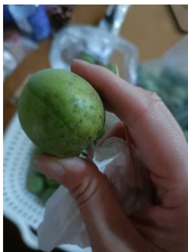
@伊娃菲 期待青梅露

用的是朋友家送的青梅,期待我的青梅露。一层青梅一层冰糖,量一比一。这次青梅我提前洗干净放冰箱冷冻了一天一夜,一周后看效果。