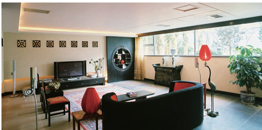
天津硅藻泥实景案例图

天津硅藻泥诞生于2003年,已走过17年,是目前硅藻泥品牌中,获得国家重点新产品、欧盟CE顶级认证的上市硅藻泥企业,且天津硅藻泥获得了国际环保标准F4星甲醛认证。在目前硅藻泥市场上,天津也是经过17年市场检验的硅藻泥品牌,口碑相传,质量与品质让人放心,所有产品系列都有抽检合格的报告。