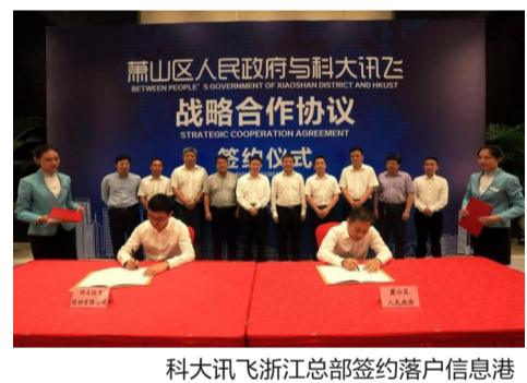
科大讯飞浙江总部签约落户信息港