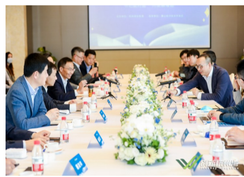
创新下午茶——政企面对面