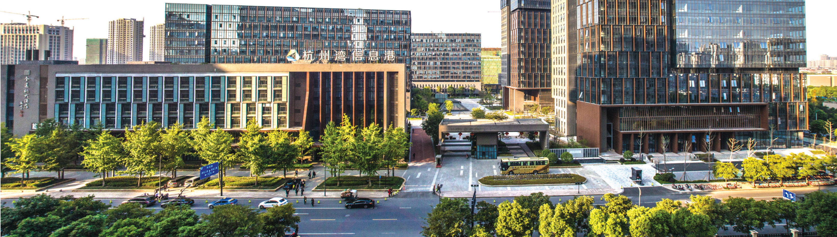
信息港小镇核心区一期、二期