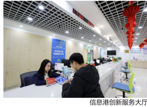
信息港创新服务大厅