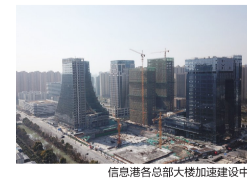
信息港各总部大楼加速建设中

厂房华丽转身,信息港特色产业不断集聚,创新效应不断释放,仅2020年,全年新增创新空间达53万平方米,持续推动产业在这方土地上成片发展。目前,信息港注册企业数达到2千多家,创客3万多名。 从“1”到“11”,透过信息港六年的扩容之路,可以清晰看到,萧山创新经济加速发展,特色产业不断集聚壮大,而这种集聚效应、溢出效应正随着信息港的不断扩容逐步放大,加速萧山新旧动能转换,赋能萧山赶超跨越发展。根据规划,未来三年将落地超300万平方米体量的创新平台和总部大楼建设,信息港小镇逐步钱塘江国际创新带“创新枢纽”的大幕已然拉开。 但谁也没想到,这团火苗充满了生命的创新活力,此后的信息港驶入了发展快车道。尤其是2016年1月入选第二批省级特色小镇