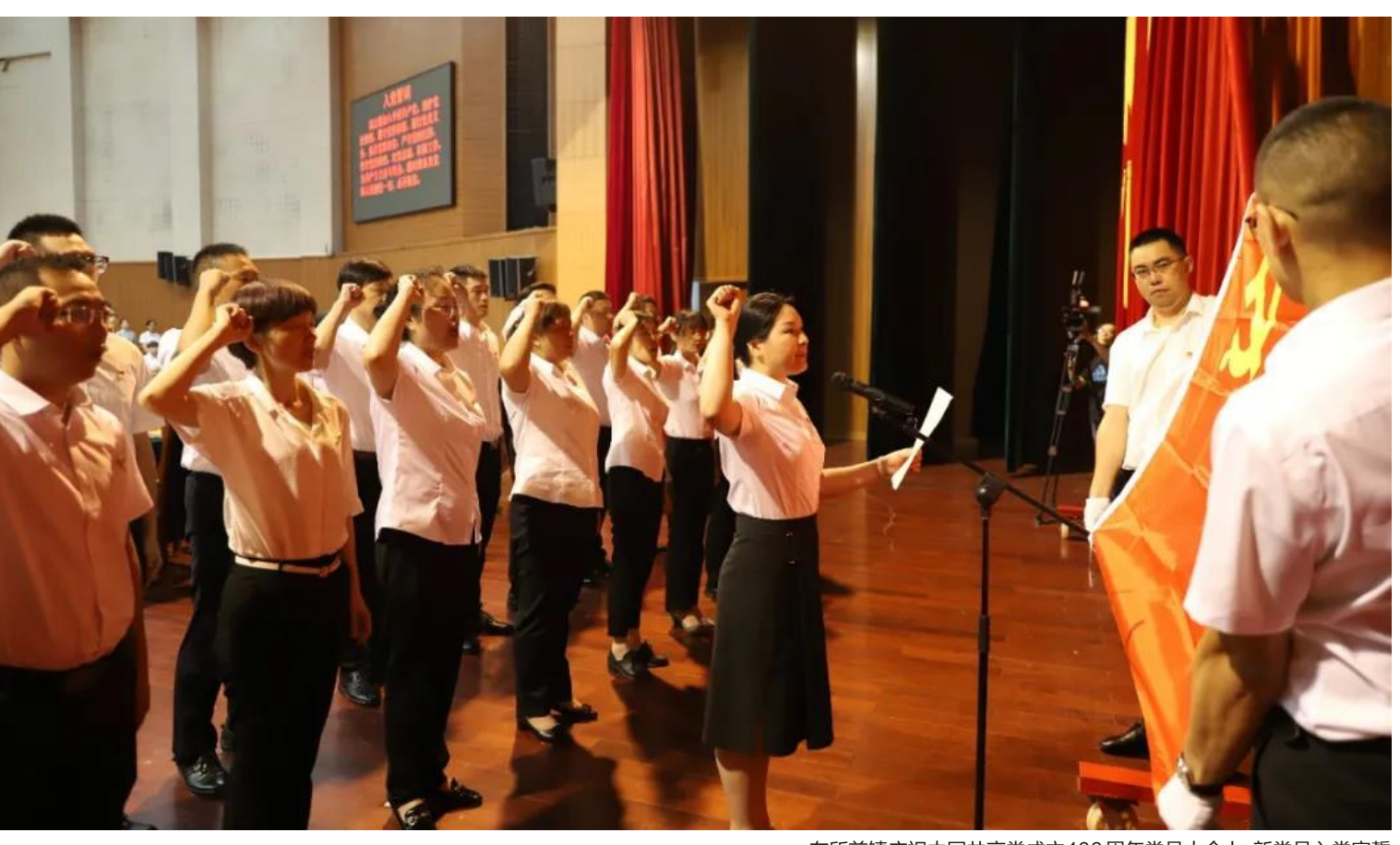
在所前镇庆祝中国共产党成立100周年党员大会上，新党员入党宣誓

百年恰是风华正茂，百年仍需砥砺奋进。27日上午，“同心齐奏 共庆建党百年——所前镇庆祝中国共产党成立100周年党员大会”隆重举行。全镇各界党员干部群众代表汇聚一堂，共同回顾我们党100年来走过的光辉历程，激励全镇各基层党组织和广大党员“不忘初心、牢记使命”，在建设“山水所前、宜居新城”中充分发挥战斗堡垒和先锋模范作用。