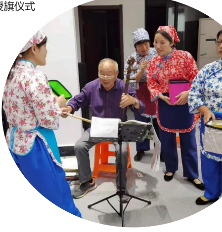
三泉王村文化礼堂晋升省五星级村文艺队在排练节目