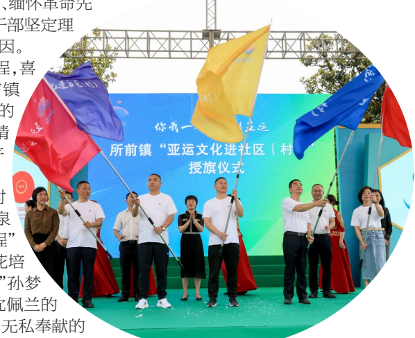
亚运文化进社区(村)授旗仪式