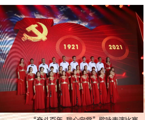
“奋斗百年、我心向党”歌咏表演比赛

百年恰是风华正茂，百年仍需砥砺奋进。27日上午，“同心齐奏 共庆建党百年——所前镇庆祝中国共产党成立100周年党员大会”隆重举行。全镇各界党员干部群众代表汇聚一堂，共同回顾我们党100年来走过的光辉历程，激励全镇各基层党组织和广大党员“不忘初心、牢记使命”，在建设“山水所前、宜居新城”中充分发挥战斗堡垒和先锋模范作用。