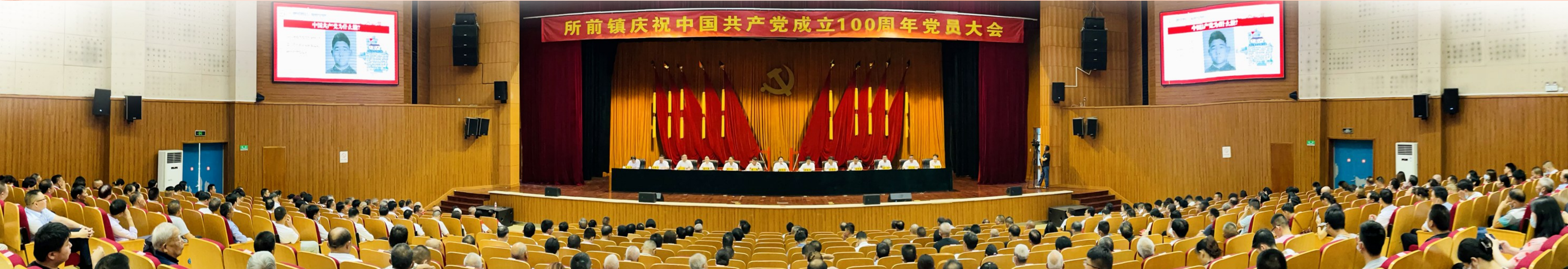
所前镇庆祝中国共产党成立100周年党员大会

“在数字化改革上要有新作为，要强化数字思维，坚持数字赋能，用数字化技术解决实际问题，提升基层治理的现代化水平。在实现共同富裕上要有新作为，做好美丽乡村产业文章，打造乡村振兴样板，办好民生实事项目，提升群众获得感、幸福感。”前不久，市委副书记、区委书记佟桂却在所前调研时提出的殷殷希望，所前正乘势而上，真抓实干，把优势转化为发展动力，努力开创高质量发展新局面。