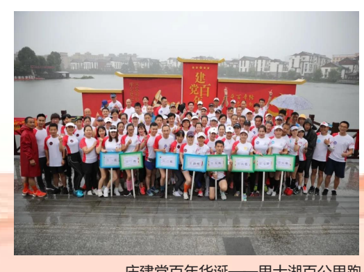
庆建党百年华诞——里士湖百公里跑

生的印记，体现了党和国家对个人奉献的高度肯定，更是激励全镇广大党员干部汲取精神力量，赓续红色基因，传承优良传统，开启新征程、建功新时代的旗帜和标杆。