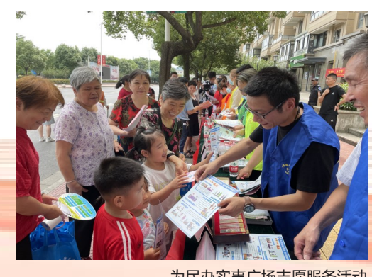
为民办实事广场志愿服务活动