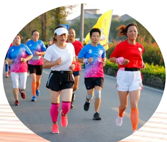
亚运临近，所前亚运氛围正浓

六月的所前，凝翠流丹，闪闪烁烁，沉甸甸的杨梅挂满树梢，一派醉人的景象。6月9日上午，以“杨梅红·中国红”为主题的第23届萧山杜家杨梅节在杭州生态园“场”启幕。