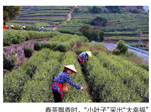
春茶飘香时，“小叶子”采出“大幸福”

杜家杨梅节作为萧山三大传统节日活动之一，至今已连续举办23届。23年来，杜家杨梅节始终坚持品牌化打造，以节为媒，以产兴业，把一系列深受百姓欢迎的庆典活动、丰富多彩乡村游活动和别具特色的地方文化主题活动融为一体，带动了区域旅游发展和农民增收致富，也极大地丰富了人民群众的精神文化生活。