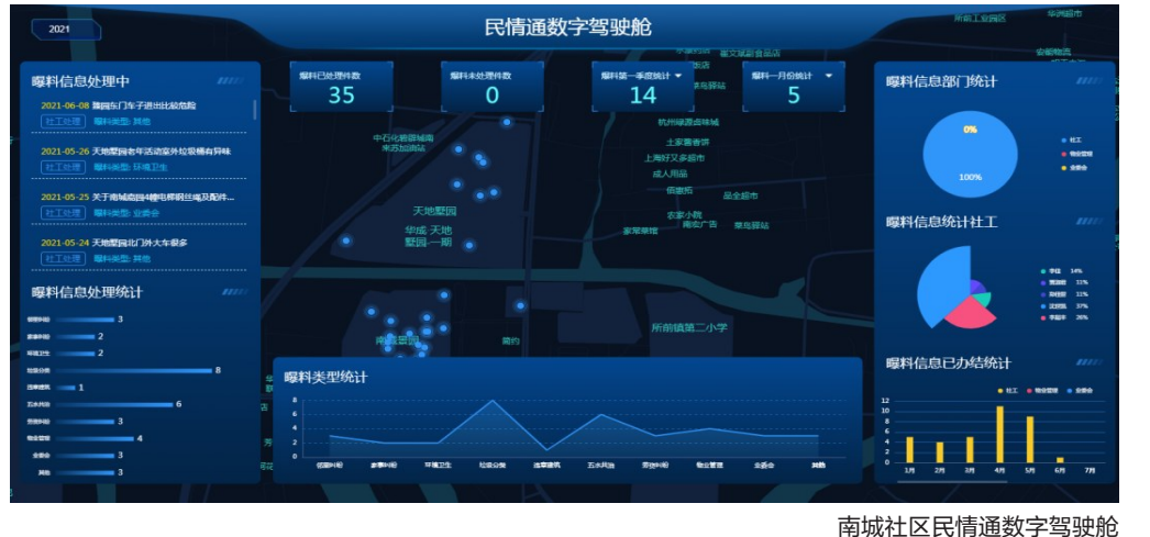
南南社区民情通数字驾驶舱

在原有传统制作的基础上，所前镇茶叶企业广泛运用先进的制茶技术和制茶手段，延伸茶产业链，提升茶叶经济价值。经过多年发展，所前搭建起遍布全国的茶叶产销网络，实现全年茶叶总销售额10亿多元，创下了“中国茶叶流通第一港”的美名。