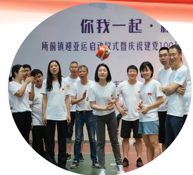
庆祝建党100周年首届职工趣味运动会