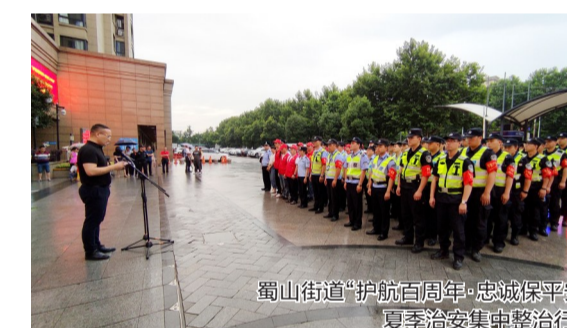
蜀山街道“护航百年·忠诚护航平安”网络安全专项行动

数字,不仅是蜀山产业转型的驱动力,更是蜀山城市治理的驱动力。随着蜀山城市化进程如火如荼,迫切要求建设者们创新手段,按下城市“治理”快进键。