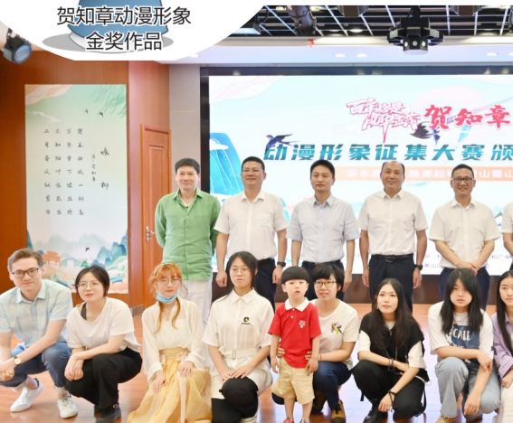
贺知章动漫形象设计大赛颁奖现场

在运营目标、运营职能、功能分区、招商政策等方面形成联动、合作共赢。在今年的蜀山产业发展清单中,更是出现了数智影视创意产业的谋划规划,在推动数字创新赋能的道路上行稳致远。