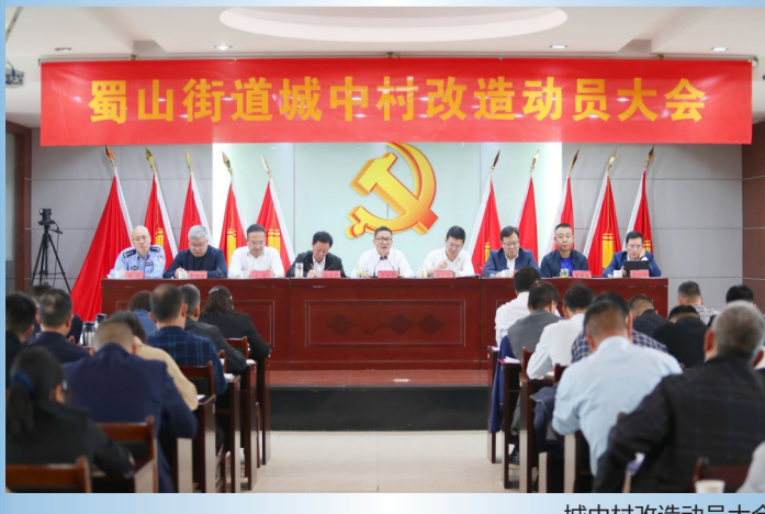
城中村改造动员大会