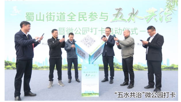
“五水共治”微公园打卡

湘湖田园项目便是蜀山城中村改造的有力实践。今年五一小长假,位于蜀山街道的湘湖田园成了新晋“网红”打卡点。城中村改造后,湘湖田园以“用地不抛地,建园不废田,资源再利用,田园当公园”为理念,依托蜀山“知章故里”文化名片,打造成为美丽环境与文化展示、教育研学、休闲游赏等各项文化服务功能融合发展的亲子公园。今年,蜀山街道击鼓再战,全面启动曹家桥、沙里吴城中村改造征迁工作。而本次涉及城中村改造的区块毗邻城市文化公园项目和浙大二院总部项目,进行城中村改造后,将最大程度发挥两个区级项目的“引擎”效应,有助于辖区市政道路的全面贯通、基础设施配套的不断完善和人居环境的美化提升,进一步打造萧山市中央活力区“南窗口”的靓丽形象。