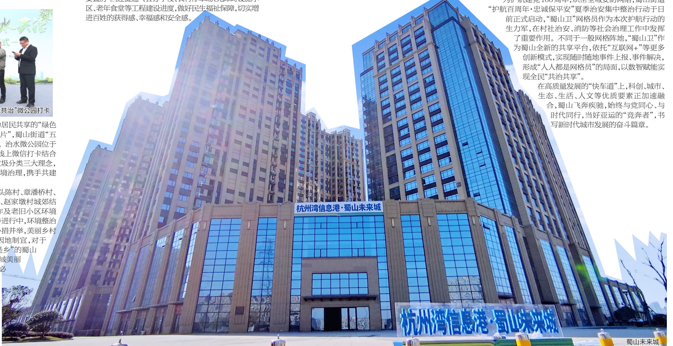
杭州湾信息港·蜀山未来城

在高质量发展的“快车道”上,科创、城市、生态、生活、人文等优质要素正加速融合,蜀山飞奔疾驰,始终与党同心、与时代同行,当好亚运的“竞奔者”,书写新时代城市发展的奋斗篇章。