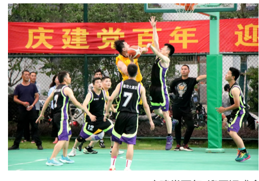
庆建党百年 迎亚运盛会