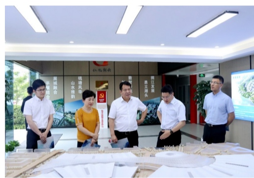
区政协主席洪松法指导大会建设

诵读活动、启动“学党史,跟党走”主题文艺巡演活动等,内容丰富、形式多样。一系列教育活动在钱塘江南岸如火如荼地开展,引导党员干部砥砺前行,以学促干,以干践学。百年党史,风华正茂。南阳不断健全红色现场教育点线,依托当地丰富的红色文化资源,在党群服务中心、滨河公园二期党建园、社区文化家园、农村文化礼堂、高帆展馆、高小展馆等设立党史学习教育打卡点,扩大党史学习教育覆盖面,营造全民学党史、知党史、铭党史的浓厚氛围。接下来,南阳将更加珍惜优胜镇街四连冠的荣誉,以昂扬的姿态,深入推进“重点工程推进年、数智改革攻坚年、作风建设提升年”活动,汇聚南阳“新力量”,跑出南阳“加速度”,以优异成绩庆祝建党100周年。