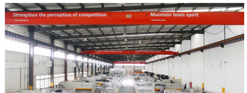
西尼机电智能工厂

3月15日南阳捷报传来,新诺科技杭州首台激光直写式光刻机下线交付,预计2021年可新增产值2亿元。“从2020年项目签约到首台设备交付,仅仅一年时间,这充分体现了企业奋力发展的决心和信心,标志着新诺微电子在南阳踏上了新的发展快车道。”街道相关负责人表示。从中山珠江边到萧山钱塘江畔,新诺微电子的引进,落户填补了萧山在该领域的空白。2021年,南阳恰逢“重要窗口”、亚运筹备、大会展中心建设、临空经济示范区建设、浙江自贸区建设等机遇,将开启“会展之都·潮韵南阳”建设新征程。南阳积极推动产业模式转型,加快新旧动能转换,加强传统产业数字化转型,加大招商引资力度,盘活存量厂房,构筑产业链集群,推动经济高质量发展。南阳抢抓智能制造,加速推进速博雷尔智能化工厂建设和新宝水泥PC构件项目建设;中小企业项目也“遍地开花”,街道共有8家企业参与智能化诊断,其中震宇家具、真誉转动