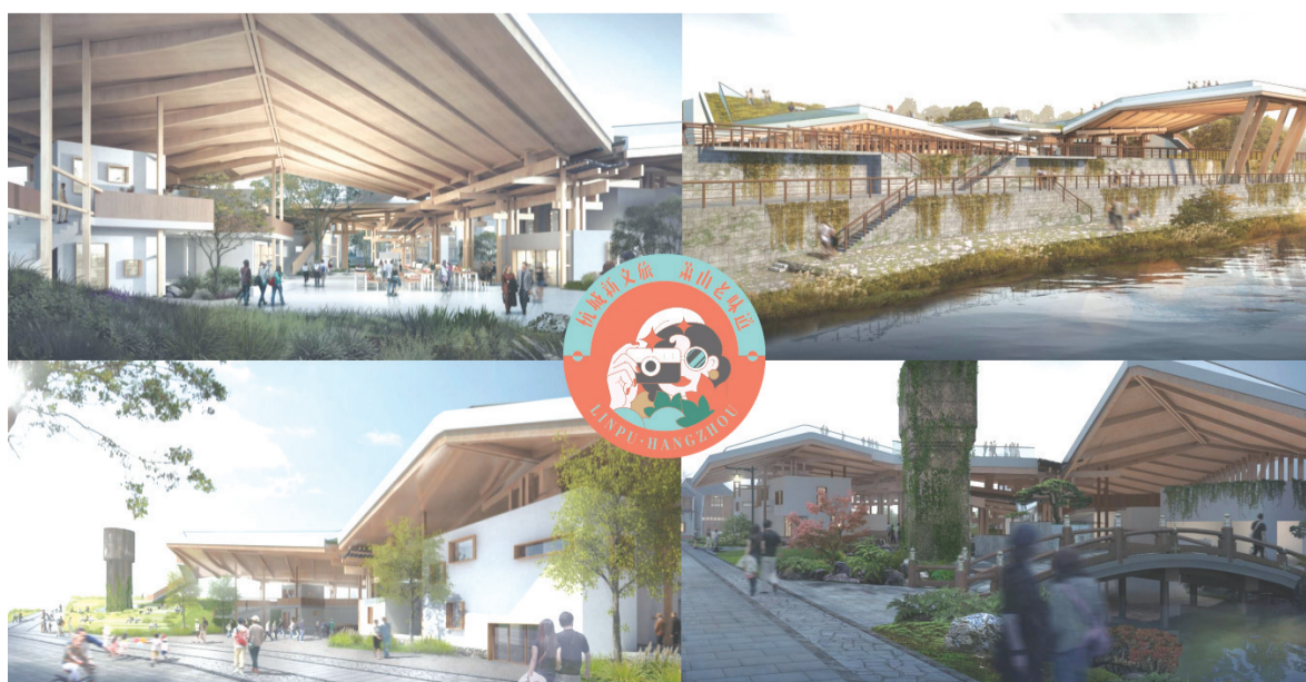
火星沉浸式体验馆效果图