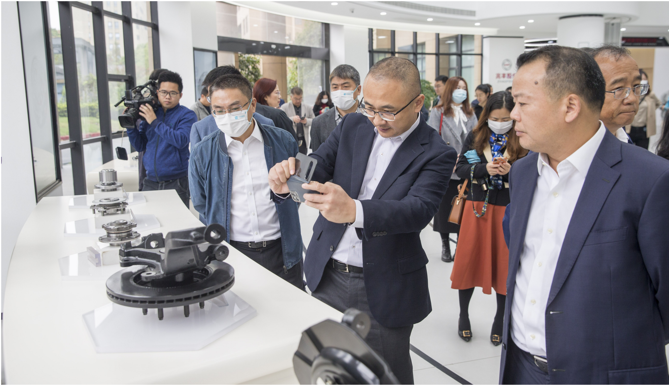
全国媒体齐聚 看萧山发展