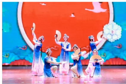
家长舞蹈《粉墨花旦》

的一天》以寓教于乐的形式,展现了老师们与孩子们快乐相处的每一天;温暖贴心的歌曲《星星》,孩子们用纯真明净的童声表达了对爸爸妈妈和老师们的爱,家长们用手中挥舞的星光点亮了家校共育的康庄大道……观众掌声连连,整个庆典呈现了家校共同成长、携手同行的温暖画面,展现了孩子们坚强、乐观、努力、勇敢的良好品格,传递了尊敬师长、