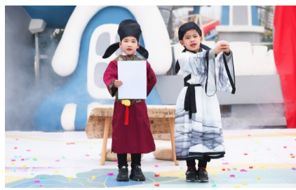
穿越时光,邂逅贺知章

开启一扇门,孩子们和贺知章一起走进了笑问农场。在体验区,一个个小而美的体验摊位整齐地呈现在大家眼前。瞬间,孩子们摇身一变,成了一名名