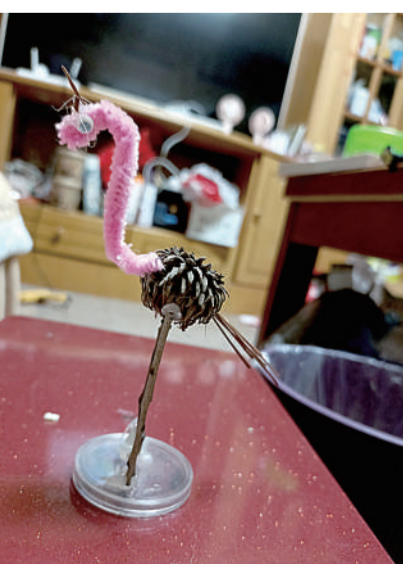
@伊娃菲 自制“周边” 周边好看但价格也让人却步,进山捡些松果、榛果等,做成自己喜欢的创新小玩意儿,挺好!健身、娱乐,何乐而不为呢!