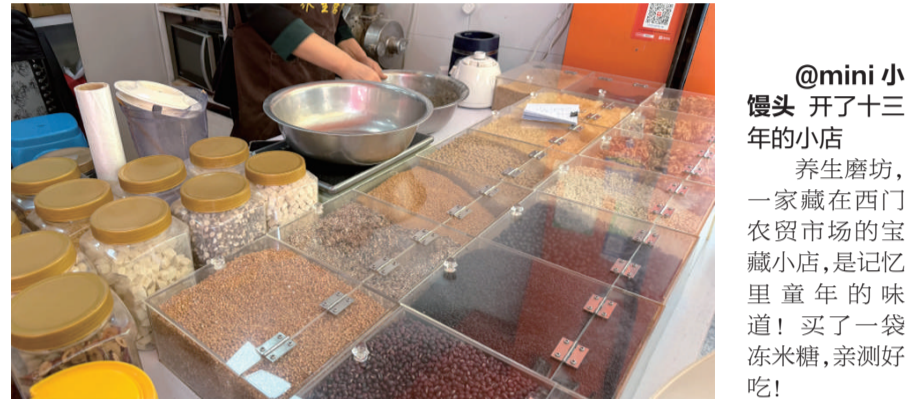
@mini 小馒头 开了十三年的小店 养生磨坊,一家藏在西门农贸市场的宝藏小店,是记忆里童年的味道!买了一袋冻米糖,亲测好吃!