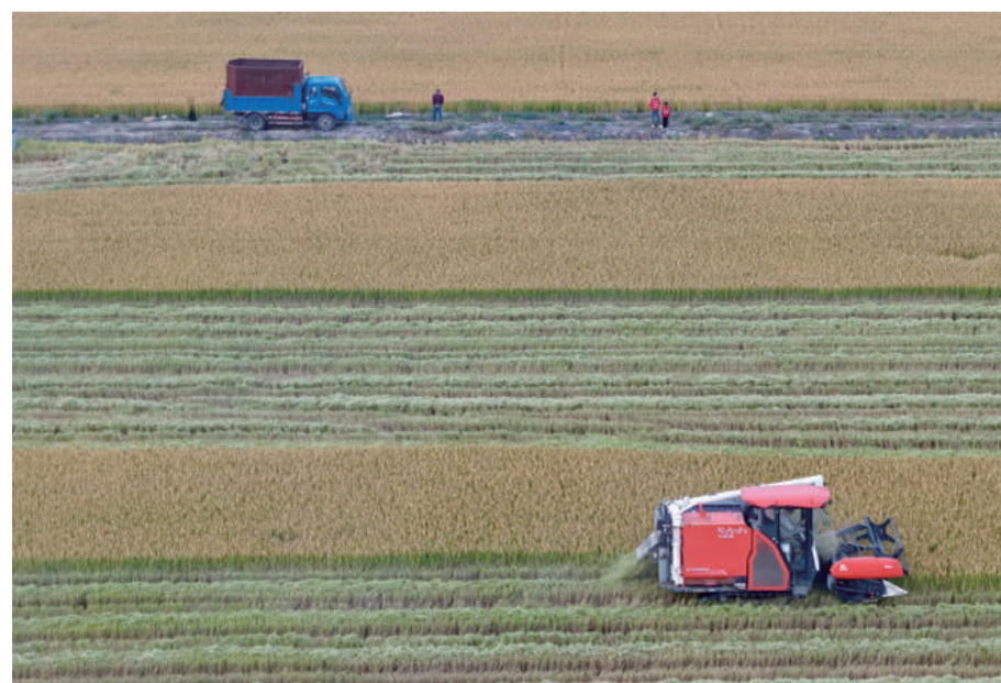
@蜗牛飞 秋收 每一粒饱满的谷穗,都藏着从春种到秋收的坚持。丰收,是时光给努力最好的答案。

在水果店买甘蔗,用的是机器削皮、切粒。近几年常见这种机器,但没近距离观察过。工作人员只需把甘蔗送进削皮口,在出口接住,再分段送入切粒处就行。整个过程正是人机协同的好例子——机器负责重复、耗力的环节,人则灵活引导流程,彼此配合,效率大大提高。