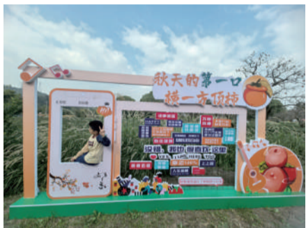
@读友_W8X67S 探柿寻秋 柿子挂满枝头红,孩童跑来捉秋风。 你追我赶林间笑,兜起阳光一篮筐。