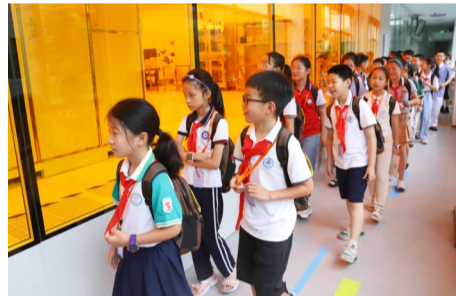
参观科创中心超净实验室