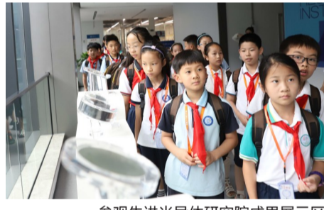
参观先进半导体研究院成果展示区