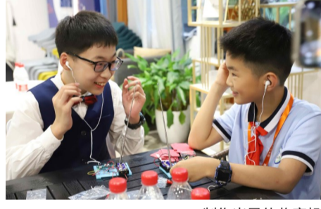
制作半导体收音机