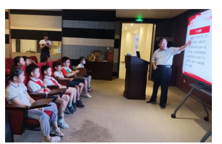
档案馆的红色课堂

历史的长河奔流不息,人类的脚步永不停止。档案馆里刻画着一个个的故事,一份份的凭证!又是收获满满的一次探秘之旅!