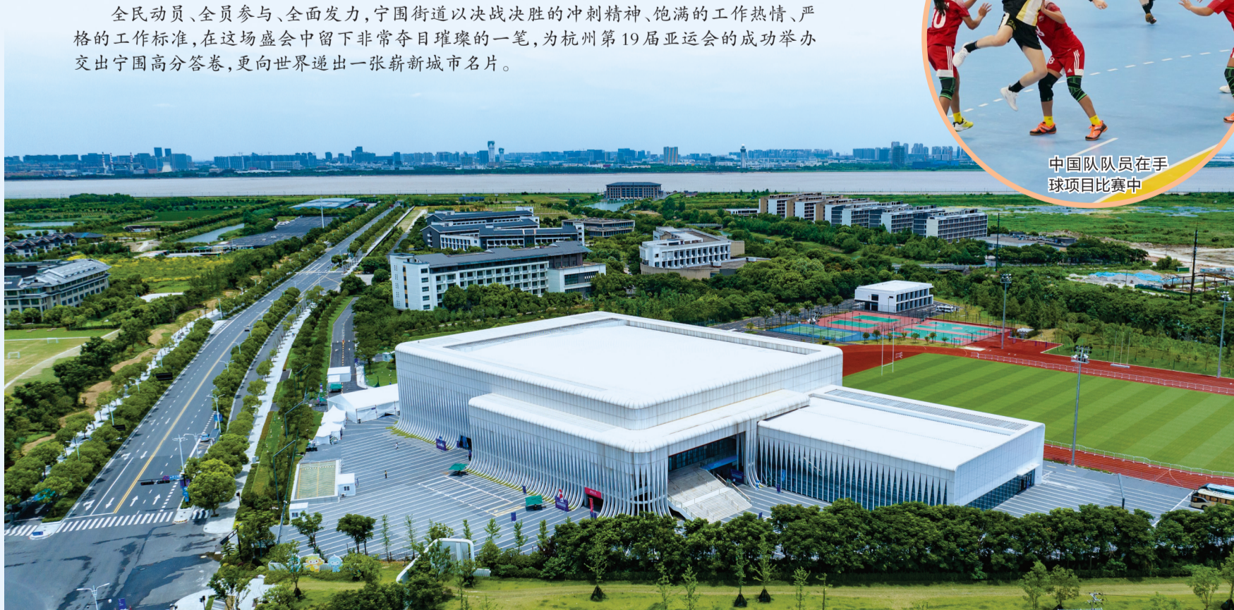
手球比赛预赛在浙江师范大学萧山校区体育馆举行