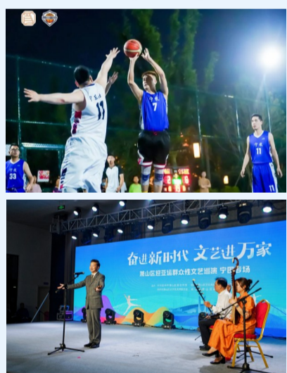
活动活动1300余场次,“新安杯”乒乓球邀请赛、“国丰杯”篮球赛、“国丰宁新杯”羽毛球赛等在内的中大型体育赛事

除了“抬头可见,驻足可观”的亚运空间元素,宁围还通过丰富多彩的文化活动与盛会相逢,依托新时代文明实践所(站),开展全民迎亚运群众性主题活动1500余场次,营造了“周周有活动,月月出精彩,季度有亮点”的亚运文体氛围。尤其是,实现村社品牌文化节全覆盖,鸿鹄邻文化节、友邻文化节、农场文化节、春耕文化节等为居民送上一场场家门口的文化盛宴;顺利开展全民健身