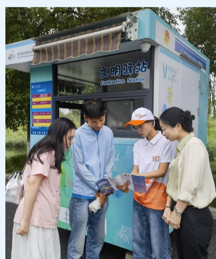
打造了活力欢快的亚运场景。同时,通过开展“安置与文明同行、生活与文明同行、观赛与文明同行、交

通与文明同行、文艺与文明同行、课堂与文明同行、志愿与文明同行、节日与文明同行”八大行动,着重上好全民学亚运、全民学英语、全民学礼仪“三堂课”,擦亮“宁围有你”的文明品牌,让每位市民在生活方方面面养成文明习惯,做文明的践行者和宣传者。