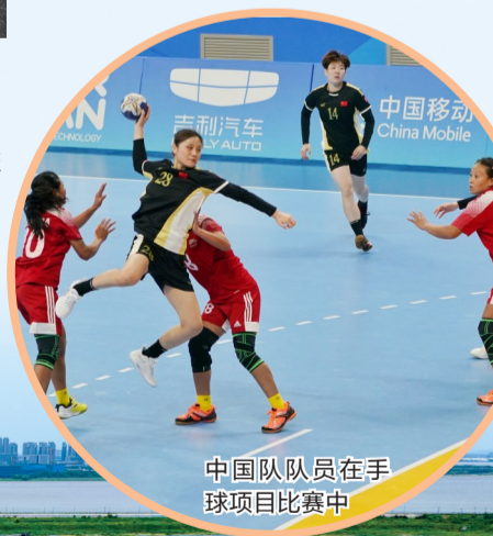
中国队队员在手球项目比赛中

此外,亚运会期间,依托“宁围有你·文明使者”亚运志愿服务圈及3.3万人志愿服务群体,宁围街道7个文明驿站24小时运行,提供高标准的亚运志愿服务,受到运动员和游客的点赞。据统计,今年以来开展志愿服务约5000场,参与志愿服务人数2万余人次,累计服务3.5万人次。