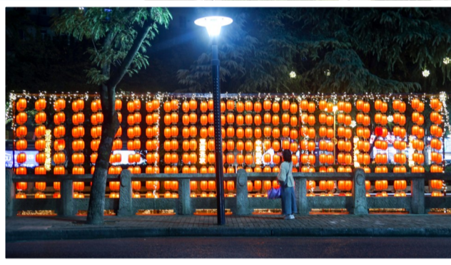
“寻梦星河”主题灯会