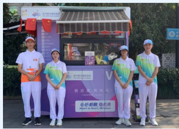
亚运文明驿站(青年V站)