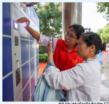
帮助游客寄存物品

萧山体育中心“亚运文明驿站(青年V站)”道源路站点就设在比赛现场,共安排了3个志愿者和2个医护人员。从早上8点半到晚上8点半,志愿者们分三个班