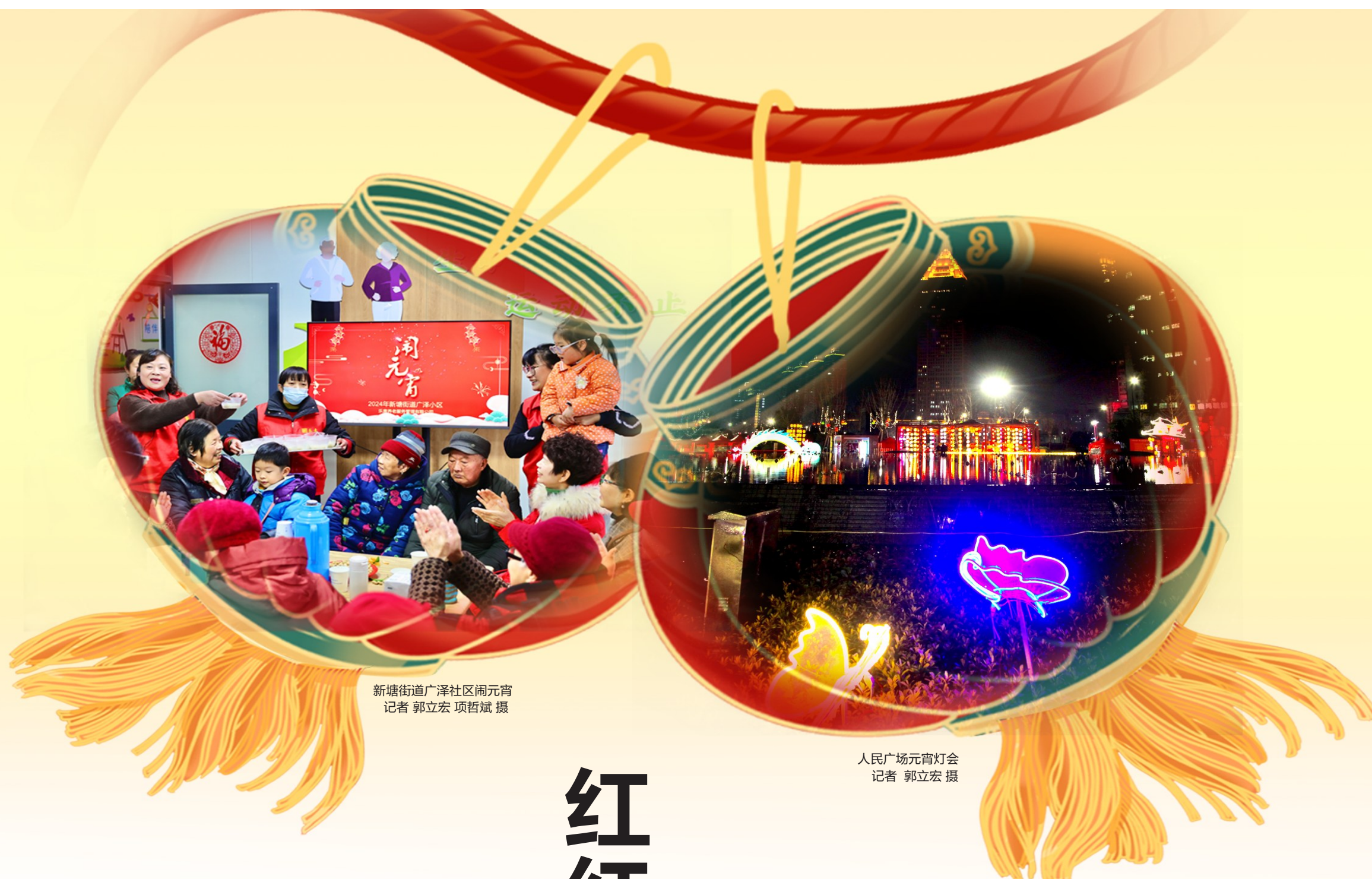
新塘街道广泽社区闹元宵