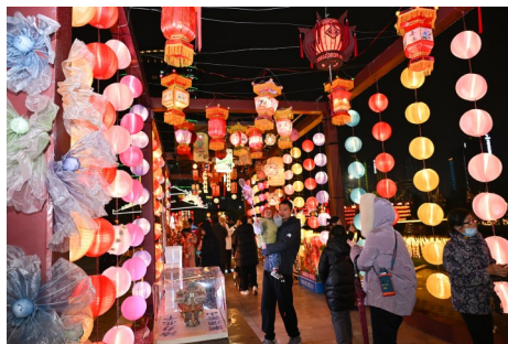
人民广场元宵灯会