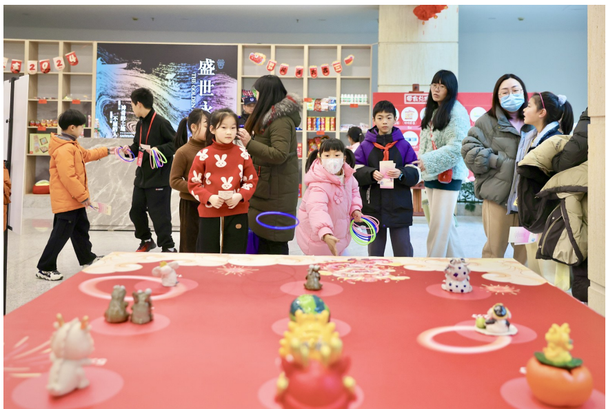
萧山博物馆怀旧运动会

正月十五闹元宵，好时好景花灯照。灯会、盘龙、舞龙等丰富多彩的民俗活动，为节日增添了浓厚的欢乐氛围和浓郁的文化气息，人们在热热闹闹的氛围中欢度元宵佳节。