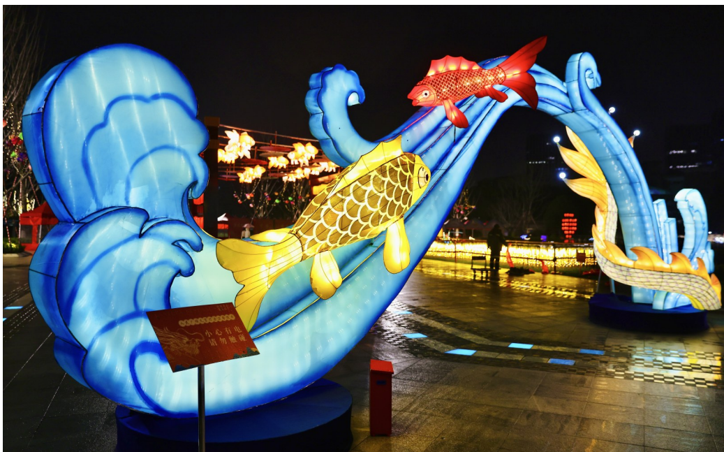
人民广场元宵灯会