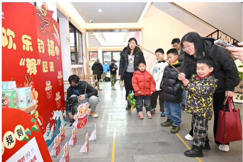
来新夏书院非遗元宵游园会

正月十五闹元宵，好时好景花灯照。灯会、盘龙、舞龙等丰富多彩的民俗活动，为节日增添了浓厚的欢乐氛围和浓郁的文化气息，人们在热热闹闹的氛围中欢度元宵佳节。