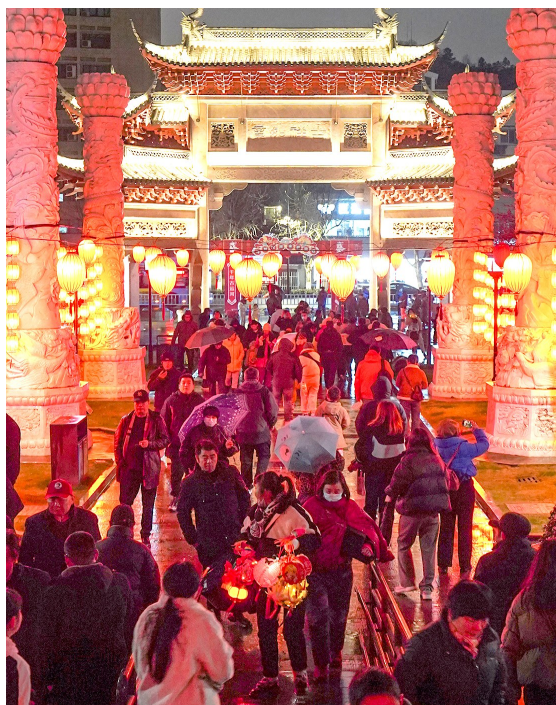
江寺公园元宵灯会