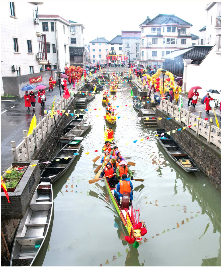
衙前镇杨汛村划龙舟、舞龙