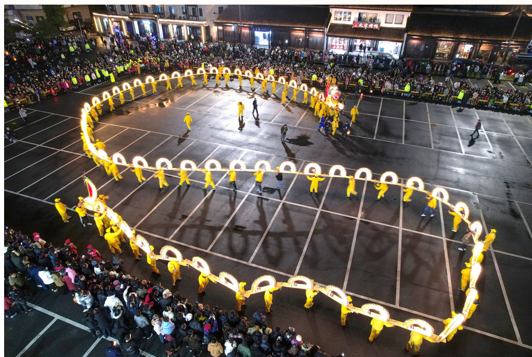
河上镇盘龙灯