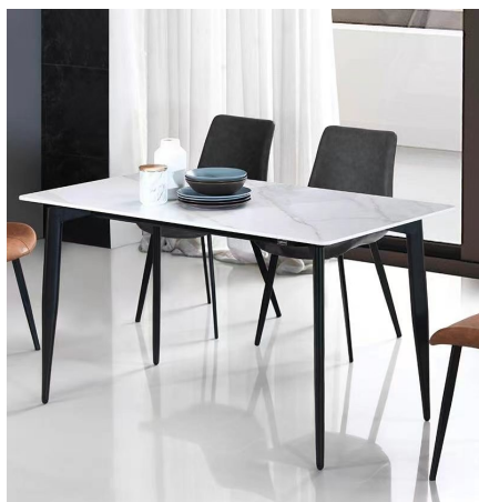
岩板餐桌(一桌四椅):1288元