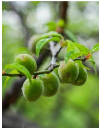
@读友_优优 青梅入夏

清风漫过初夏枝头,青涩梅子挂满枝桠。亲手摘下一树玲珑青梅,收藏夏日独有的清甜。洗净果肉,慢熬封存,把转瞬即逝的夏日阳光,都温柔藏进酸甜味里。