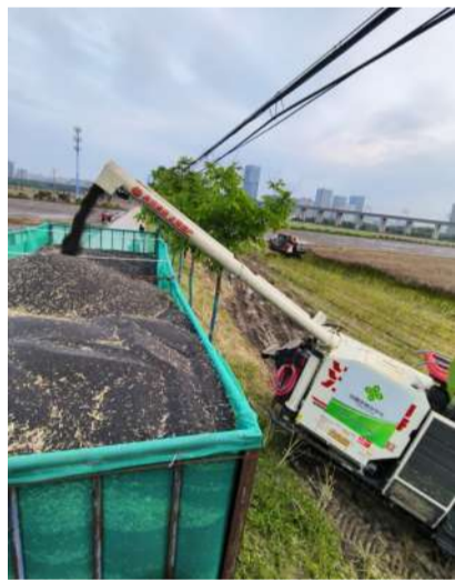
@读友_BE48S9 高架下的农忙

时值初夏,油菜麦子成熟,钱江世纪城的CBD油菜地里,收割机在夕阳下回来穿梭,运输菜籽的大卡车越装越满,颗粒归仓。