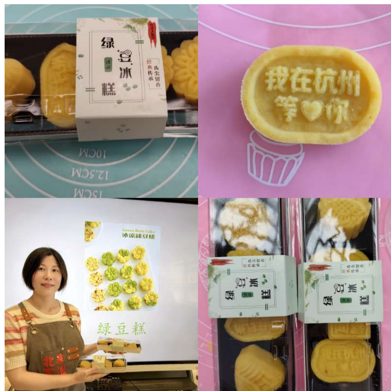
@许云兰 手作绿豆糕

周末参加了社区组织的手制作绿豆糕活动,女儿马上就要高考了,想亲手给她做个定胜糕。活动中,老师耐心讲解步骤,跟着老师一步一步地学,每一个环节都充满了乐趣。虽然没有定胜糕的模具,但把一团团绿豆泥变成精致的小糕点,心里满是成就感。我把这绿豆糕带回家留给女儿吃,希望她能在紧张的备考中尝到妈妈的爱,也希望这甜甜的绿豆糕能给她带来好运,祝她高考顺利,取得理想的成绩!